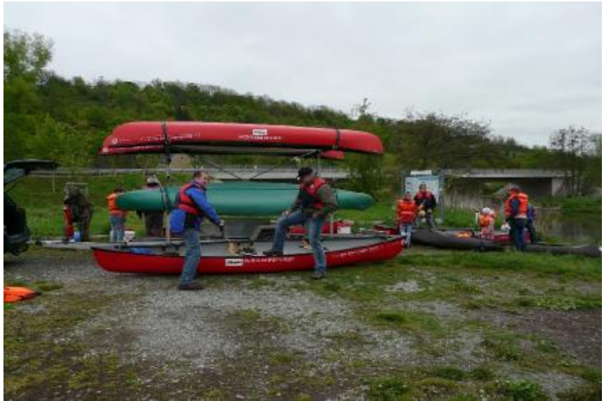
Vatertags-Kanutour 2010 auf der Werra; Einstieg Creuzburg, © Marcus Gnau

Die erste Tagesetappe beginnen wir am Fronleichnamstag bei Flusskilometer 104,8 in Creuzburg neben der Werrabrücke der B7 (51°02'56.6"N 10°14'58.8"E). Bereits wenige Flussmeter später unmittelbar hinter der alten Werra-brücke finden sich die ersten Untiefen, die durchaus für Gaudi sorgen können, aber nicht gänzlich anspruchlos sind. Dort sind bei vergangenen Kanutouren unseres Vereins durchaus schon mehrere Teilnehmer mit ihren Booten gekentert. Aber keine Angst, direkt an den Untiefen kann man mitten im Fluss stehen. Das Wasser ist dort in der Regel nur knöchel- bis wadentief.