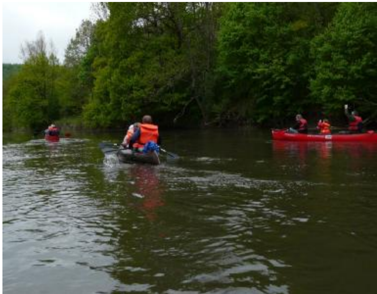
Vatertags-Kanutour 2010 auf der Werra

Nachdem wir das beschauliche Creuzburg mit seiner romanischen Burganlage aus dem Jahr 1170 n. Chr. und der romanischen Nikolaikirche aus dem 12. Jahrhundert passiert haben werden, werden wir am linken Flussufer die Kalksteinbänke „Ebenauer Köpfe“ erblicken. Am Wehr in Mihla bei Fluss-kilometer 95,3 müssen wir die Boote umtragen. Dies nutzen wir für eine ausgedehnte Pause.