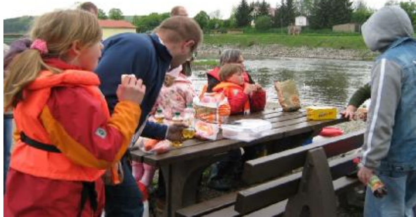
Pause am Wehr in Miha

Nach dem Wiedereinsetzen der Kanus hinter dem Wehr erwarten uns längere Abschnitte mit kleinen Stromschnellen, die leicht zu überwinden sind und insbesondere den Kindern viel Spaß machen. Nachdem das Wasser wieder ruhig fließt, schlängelt sich die Werra zwischen den Höhenzügen durch die sehr beschauliche Natur bis zu unserem Basecamp. Auf diesem Flussabschnitt hat anlässlich der Vatertags-Kanutour 2010 meine damals 11-jährige Tochter das Steuern eines Kanadiers erlernt.